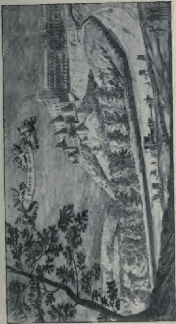
Le Palais de Madrid vu du côté de la Casa del Campo. Gravure du XVIII e siècle.